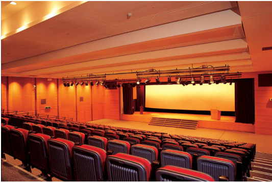
코리아디자인센터 6층 컨벤션홀