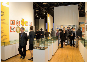
2019 DK뮤지엄 개관 디자인코리아 뮤지엄