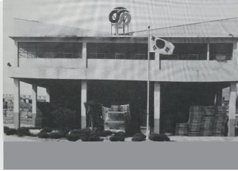
1971 부산 지소 개소 부산 중앙동