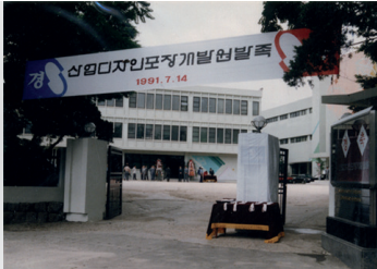
1991 산업디자인포장개발원 발족