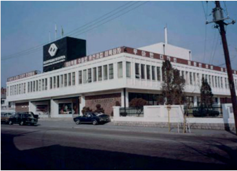
1970 한국디자인포장센터 설립 서울시 종로구 혜화동 대학로

디자인 진흥을 통하여 수출구조를 획기적으로 개선하는 것을 목표로 1970년 설립된 한국디자인포장센터에서 시작하여 2001년 디자인 인프라 종합시설인 현 코리아디자인센터 완공에 이르기까지 종합적이고 효율적인 디자인 진흥 및 지원을 위한 인프라 구축에 힘을 쏟은 한국디자인진흥원은 지난 2019년 디자인 주도 제품개발지원센터이자 스타일테크 공유오피스인 DK웍스 개소로 4차 산업혁명 기술이 융합하는 혁신공간 구축이라는 새로운 발자취를 역사에 남겼다.