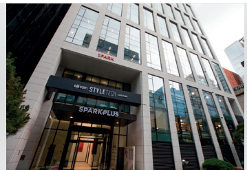
2019 DK웍스 스타일테크 혁신성장공간 개소