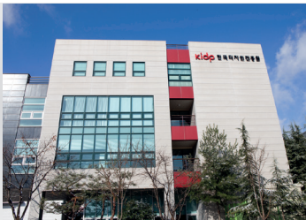
2016 대전 지원 개소