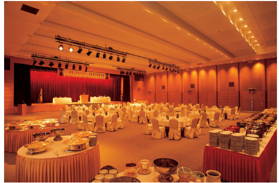
코리아디자인센터 6층 컨벤션홀