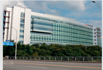
2001 코리아디자인센터(KDC) 입주 경기도 성남시 분당구 야탑동