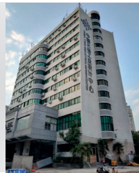
2015 한국디자인 이우비즈센터 개소