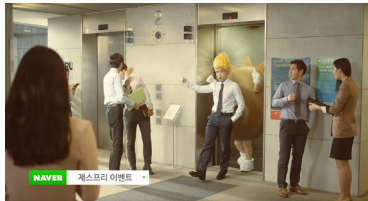
CF <제스프리 섀플드 키위>, 2015.