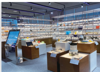
2020 DK웍스 경남 디자인주도제조혁신센터 개소