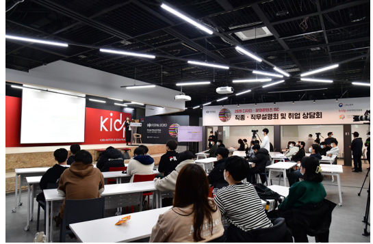
코리아디자인센터 B1 DK캠퍼스