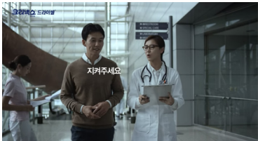
CF <크리넥스 드라이셀 핸드타올>, 2015.