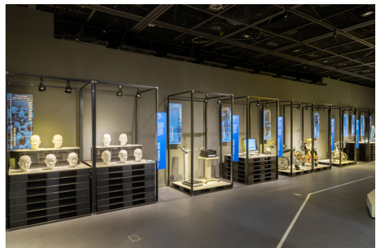
코리아디자인센터 B1 사이즈코리아