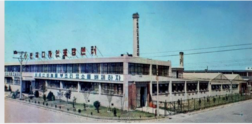
1973 한국디자인포장센터 공장 개원