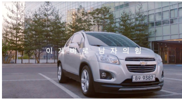
CF <쉐보레>, 2016. 출연 강하늘, 설인아