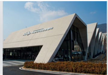
2015 미래디자인융합센터 개관