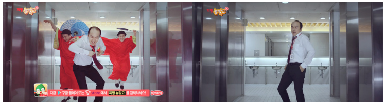
CF <피망 고스톱 게임>, 2015. 출연 김광규