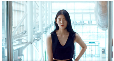
CF <닥터마틴>, 2016.