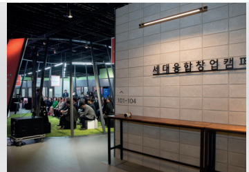
2018 세대융합창업캠퍼스 개소