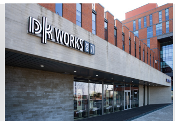
2020 DK웍스 경기 디자인주도제조혁신센터 개소