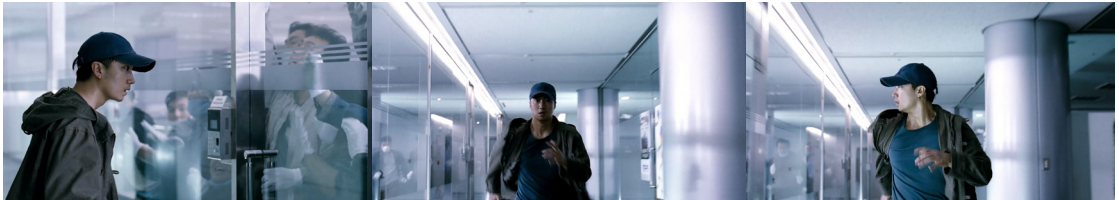
영화 <괴물>, 2006. 감독 봉준호, 출연 송강호, 변희봉, 박해일, 배두나, 고아성