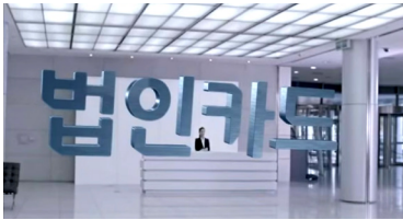
CF <현대카드-MY COMPANY편>, 2012.