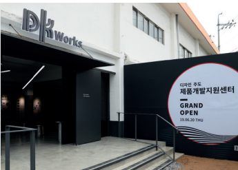
2019 DK웍스 서울 디자인주도 제품개발지원센터 개소