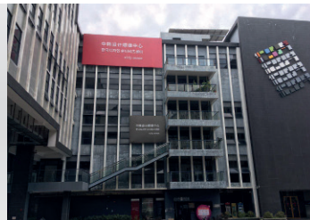
2019 한국디자인 순더비즈센터 개소