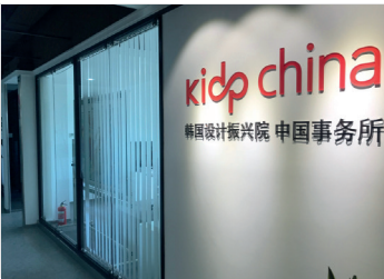
2013 한국디자인진흥원 중국센터