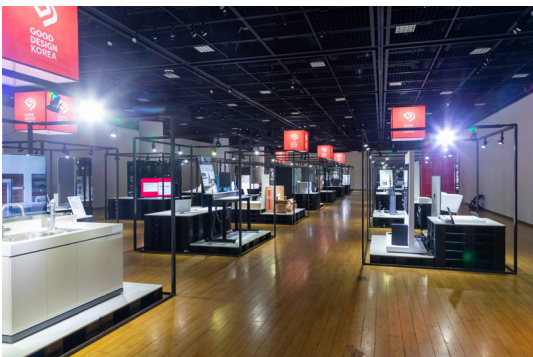
코리아디자인센터 B1 2020 DK페스티벌 수상작 전시